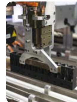
Umlauftrack in der automatischen Verarbeitung