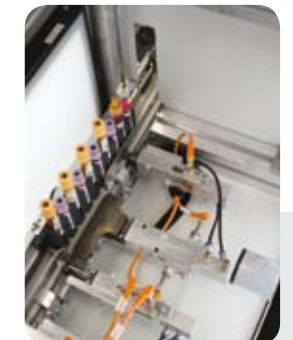
Kamera zur automatischen Registrierung